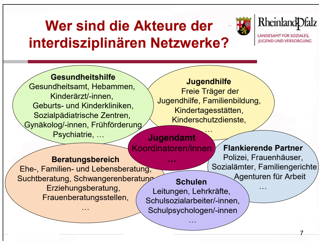
(Abb. 1: Akteure der interdisziplinären, lokalen Netzwerke)

Die Grafik zeigt die Beteiligten Akteure der lokalen Netzwerke im Überblick: