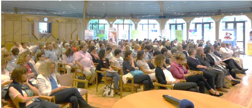
Kinderschutzkonferenz im Schloss Waldthausen

Die Servicestelle Kinderschutz (Referat 34) und das Sozialpädagogische Fortbildungszentrum (SPFZ) luden am 12. Juni in Kooperation mit dem Ministerium für Familie, Frauen, Jugend, Integration und Verbraucherschutz (MFFJIV) zur zweiten landesweiten Kinderschutzkonferenz in Rheinland-Pfalz ein. Mit der Veranstaltung wurde auch das 10-jährige Bestehen des Landeskinderschutzgesetzes gewürdigt, welches im März 2008 in Kraft getreten ist. Der interdisziplinäre Fachtag im Schloss Waldthausen in Budenheim stieß auch in diesem Jahr auf großes Interesse und war mit fast 170 Fachkräften aus der Kinder- und Jugendhilfe, dem Gesundheitswesen und angrenzenden Institutionen und Beratungsdiensten gut besucht.