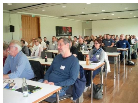
Teilnehmerinnen und Teilnehmer