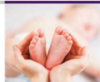
Flyer der Fortbildungsmaßnahme

FAMILIENHEBAMME/ FAMILIEN-GESUNDHEITS- UND KINDERKRANKEN- PFLEGER/-IN