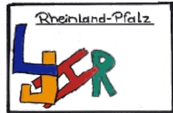
Logo des Landesjugendhilferats

Damit ist Rheinland-Pfalz das fünfte Bundesland, in dem es ein Interessensvertretungsgremium von und für junge Menschen gibt, die in Einrichtungen der stationären Hilfe leben.