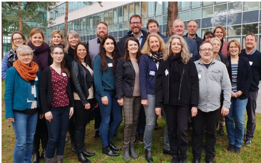
Die Arbeitsgruppe und die Agenturen

Im Oktober 2020 startete die von der Bundesarbeitsgemeinschaft (BAG) Landesjugendämter gemeinsam mit Jugendämtern getragene neue deutschlandweite Offensive zur Arbeit der Jugendämter. Ziel der Offensive ist es, die Leistungen und die gesellschaftliche Bedeutung der Jugendämter in positiver Weise ins Licht der Öffentlichkeit zu rücken, auch um einen Kontrapunkt zur immer noch vielfach negativen Berichterstattung zu setzen. Die BAG Landesjugendämter knüpft dabei an die Aktionswochen der vergangenen 10 Jahre an, in denen Jugendämter sich alle zwei Jahre jeweils zu verschiedenen Schwerpunktthemen gemeinsam öffentlich präsentiert haben.