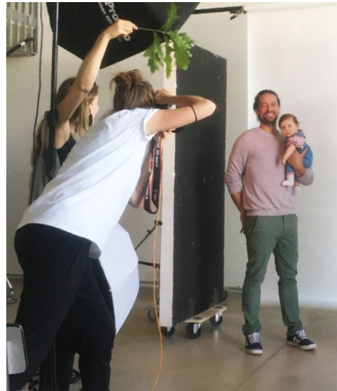
Fotoshooting zur Erstellung der Werbeplakate

Auch die lokalen Aktionswochen, die bundesweit für April und Mai 2021 vorgesehen sind, werden nur bedingt in traditioneller Form mit Veranstaltungen und viel Präsenz im öffentlichen Raum stattfinden können. Die AG Öffentlichkeitsarbeit der BAG Landesjugendämter strickt gemeinsam mit den beteiligten Agenturen an neuen Formen für die Öffentlichkeitsarbeit, für die schon viele kreative Ideen entwickelt wurden und die auch jenseits der aktuelle Offensive einsetzbar sein werden.